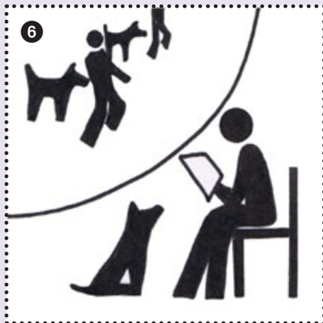
6 Beim richtigen Ring warten und Einsatz nicht verpassen