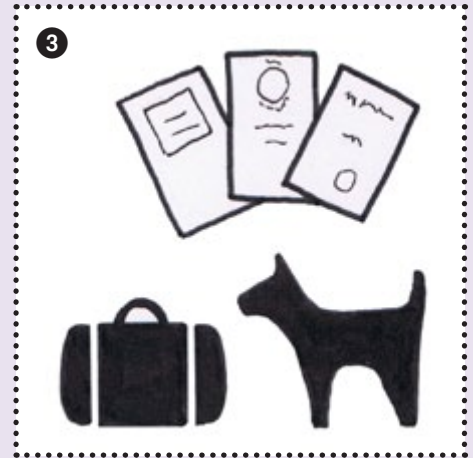
3 Alles dabei? Am Vorabend Dokumente kontrollieren