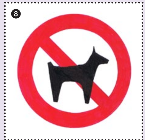
8 Nicht erlaubt: An Ohren oder Rute kupierte Hunde