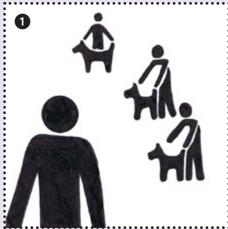
1 Wie läuft eine Ausstellung ab? Erster Besuch ohne Hund