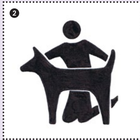
2 Präsentieren, Traben & Co.: Unbedingt zu Hause üben!