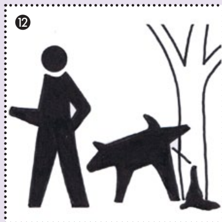
12 Den Hund bewegen und regelmäßig versäubern lassen