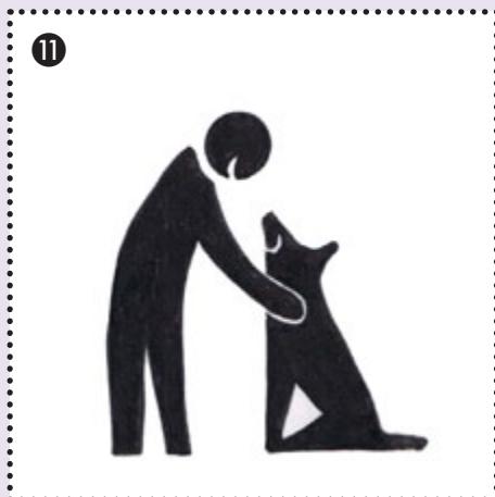
11 Faires Verhalten gegenüber Hund, Richter und Personal