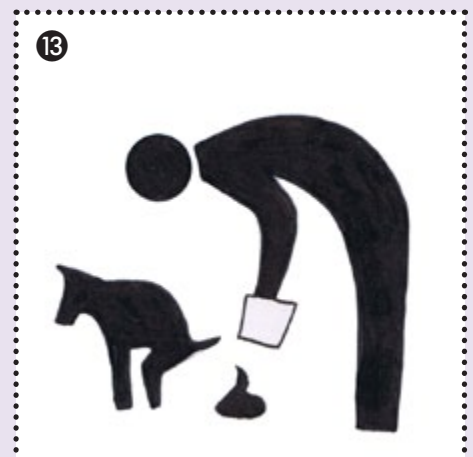
13 Kotauflnahmepflicht auf dem ganzen Ausstellungsgelände